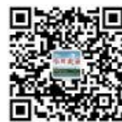
《今日定安》微信公众号二维码

9月1日，塔岭幼儿园就将迎来第一批幼儿，将改善全县学前教育基础设施薄弱的现状，有力提升教育教学质量。据介绍，今年，定安将继续新建龙州潭黎、龙河安良2所公办幼儿园，新增公办学位360个。