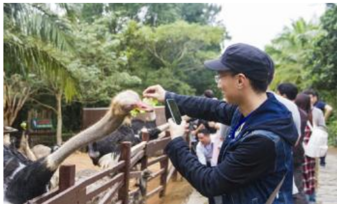
游客在飞禽世界给鸵鸟喂食。

8月23日,记者获悉,为回馈广大游客和旅游业同行对景区多年来的关心和支持,海南热带飞禽世界将于8月25—26日实行特别优惠活动: