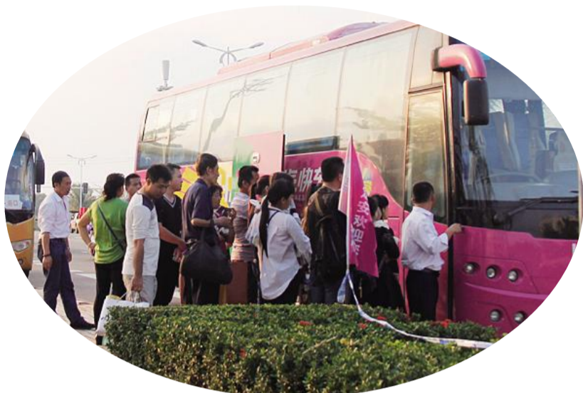
游客乘坐免费大巴。

6月8—11日，定安天九美食文化广场人山人海，热闹非凡。在广场西侧，井井有条的长队一字排开，走近一看，原来是2016年第四届海南乡村旅游文化节暨海南（定安）端午美食文化节免费大巴、公交直通定安天九活动现场的游客