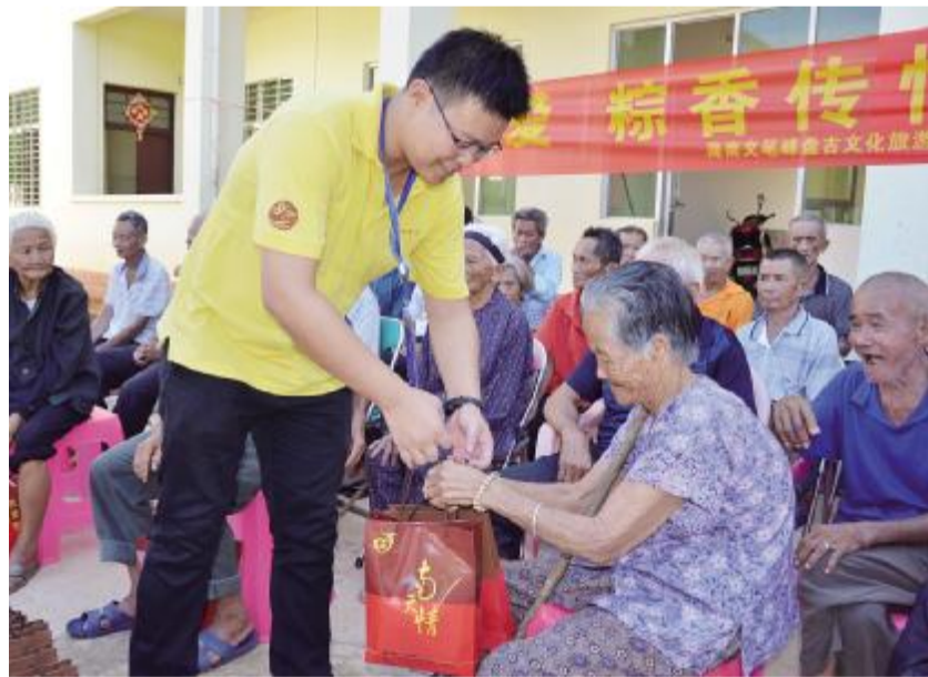
工作人员为老人送上端午慰问品。

文笔峰景区总经理王克珉说：“尊老敬老是中华民族的传统美德，在文笔峰更是如此，弘扬孝道文