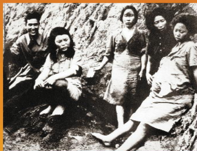
日军在发动全面侵华战争后，由日本军部“统筹”，在其占领区设立所谓“慰安所”，大批中国妇女被强迫充当日军的性奴隶。图为中国军队从“慰安所”中解救的妇女。