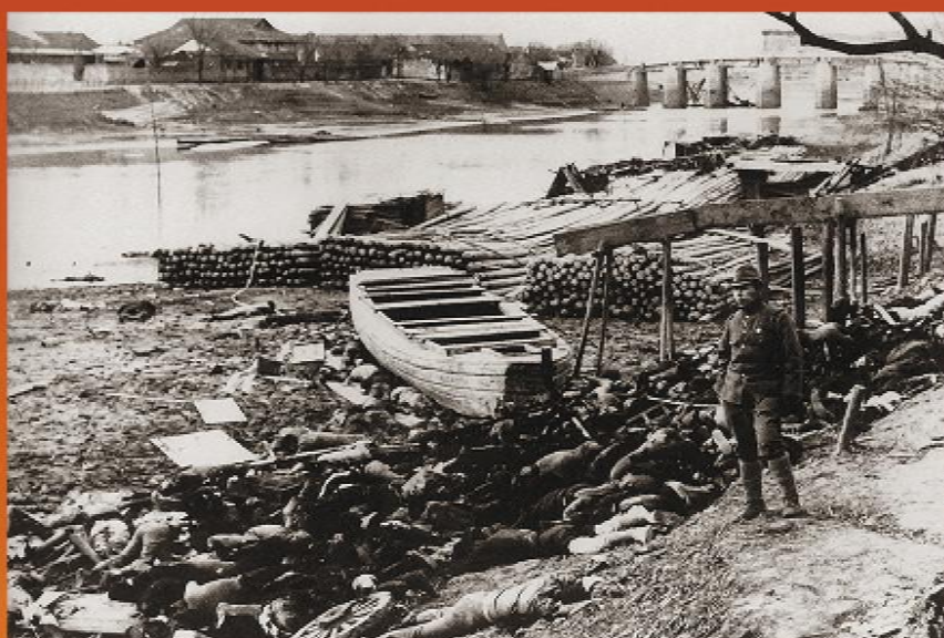
1937年12月13日日军占领南京后，在南京地区进行大规模的烧杀淫掠持续达六星期之久，中国平民和被俘士兵被集体枪杀、焚烧、活埋以及用其他方法处死者，达30万人以上。图为日军杀害中国人之后，又放上木柴，浇上汽油，纵火焚烧尸体。

在侵华战争中，日本侵略者对中国人民进行惨无人道的屠杀、迫害和摧残，对中国不设防城市和大量非军事目标进行狂轰滥炸，残酷虐杀战俘，强制奴役劳工，强征“慰安妇”，实施细菌战和化学战，在占领区实行殖民统治，推行奴化教育，用鸦片毒害中国人民，控制中国的工矿、交通、农业、金融、贸易等经济命脉，掠夺中国经济和文化资源，犯下了罄竹难书的累累罪行，给中国人民带来深重灾难，在现代文明史上留下了最黑暗的一页。