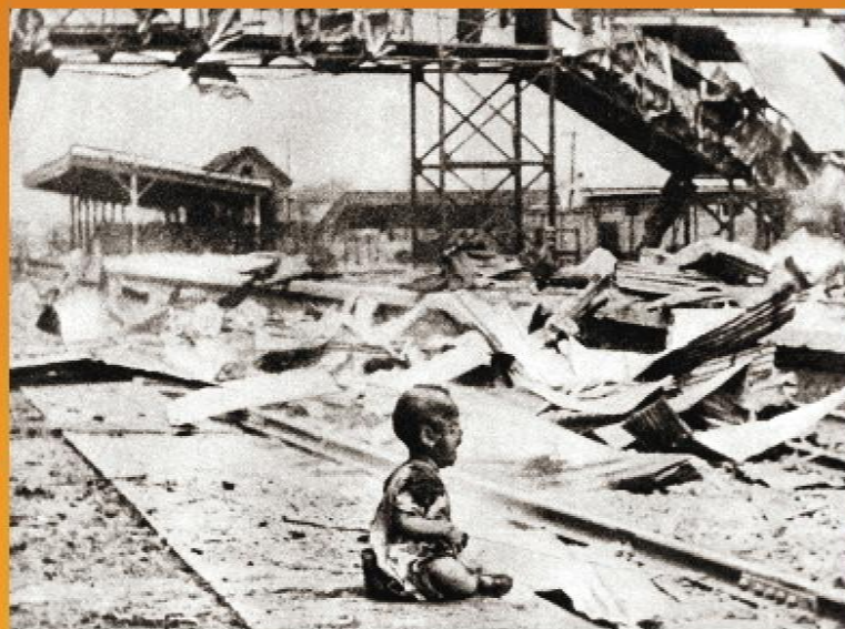
在侵华战争期间，日军违反国际法，把空中轰炸作为大规模屠杀中国无辜民众的重要手段，对中国900多座城市和广大乡村实施无差别轰炸，给中国人民的生命财产造成了重大损失。图为1937年8月28日，上海南站日军空袭下的儿童。