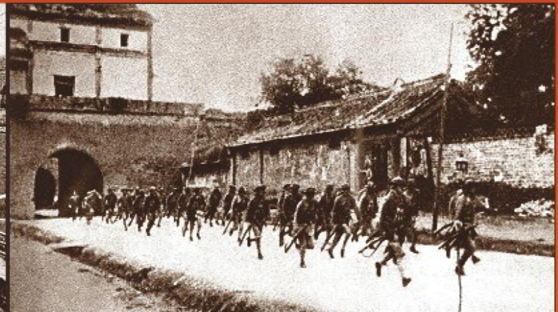
1937年日本制造七七事变，发动全面侵华战争，中国守军奋起抵抗，中国全民族抗战开始。图为驻守宛平县城的第29军士兵跑步进入阵地。