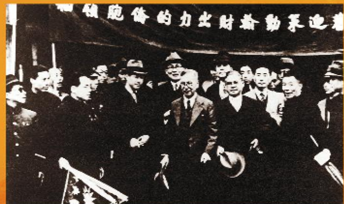
海外华侨积极支援祖国抗战。图为1940年3月，爱国侨领陈嘉庚率“南洋华侨回国慰劳视察团”慰问抗战军民。