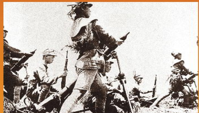
1938年6月至10月，中国军队为保卫武汉同日军展开大规模作战。中国军队投入兵力近百万，日军投入兵力25万。武汉会战是全民族抗战爆发以来战线最长、规模最大、持续时间最长的一次会战。武汉会战后，侵华日军被迫停止战略进攻，中国抗日战争进入战略相持阶段。图为中国军队用迫击炮向日军射击。