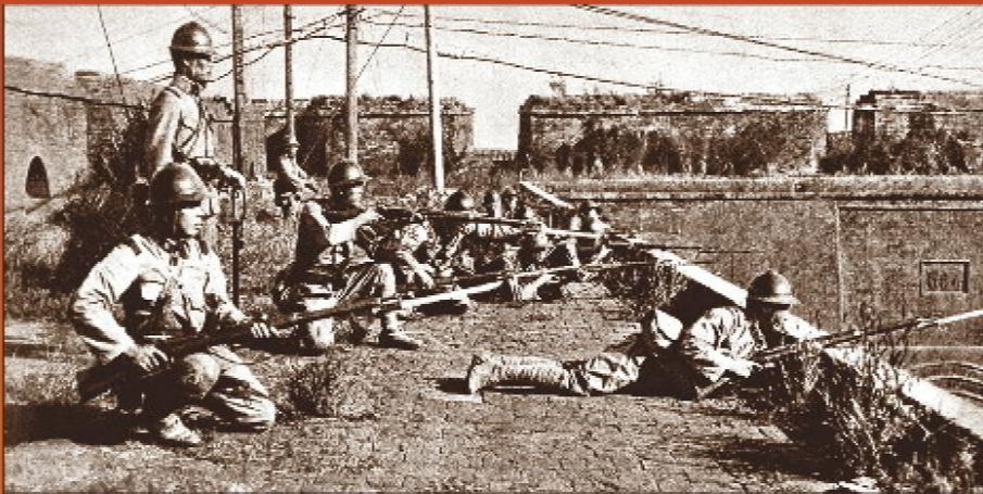
1931年9月18日，日本制造九一八事变，武装侵略中国东北。国民党政府推行“攘外必先安内”的错误方针，采取“不抵抗”政策，东北迅速沦陷。图为日军在沈阳外攘门上向中国军队进攻。

日本帝国主义于1931年制造九一八事变，强占中国东北。1937年日本制造七七事变，发动全面侵华战争。中国守军奋起抵抗，中国全民族抗战开始。中国共产党号召全国同胞团结起来，抵抗日寇侵略。在中国共产党的积极推动下，以国共两党合作为基础的抗日民族统一战线正式形成。全国抗日武装开赴前线，正面战场、敌后战场协同配合，共同抗击日本侵略，开始神圣的全民族自卫战争，开辟了世界第一个大规模反法西斯战场。