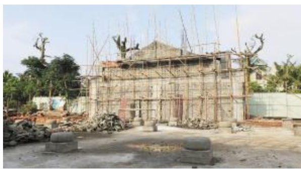
正在重建修复的古县衙。

近年来,县委、县政府十分重视定安的古建筑保护,并以提升定安历史人文景观气息、改善基础公共设施为目的,对古县衙