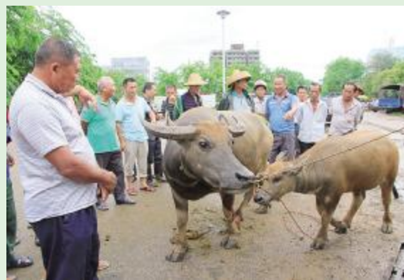
仙沟牛市每天都有近千只牛进行交易，牛市曾在80年代闻名岛外，图为8月18日仙沟牛市正在进行交易。