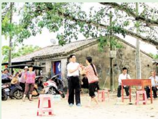
新竹镇卜效村被喻为琼剧村。9月14日，村中老少在大树下唱着自导自演的琼剧节目。