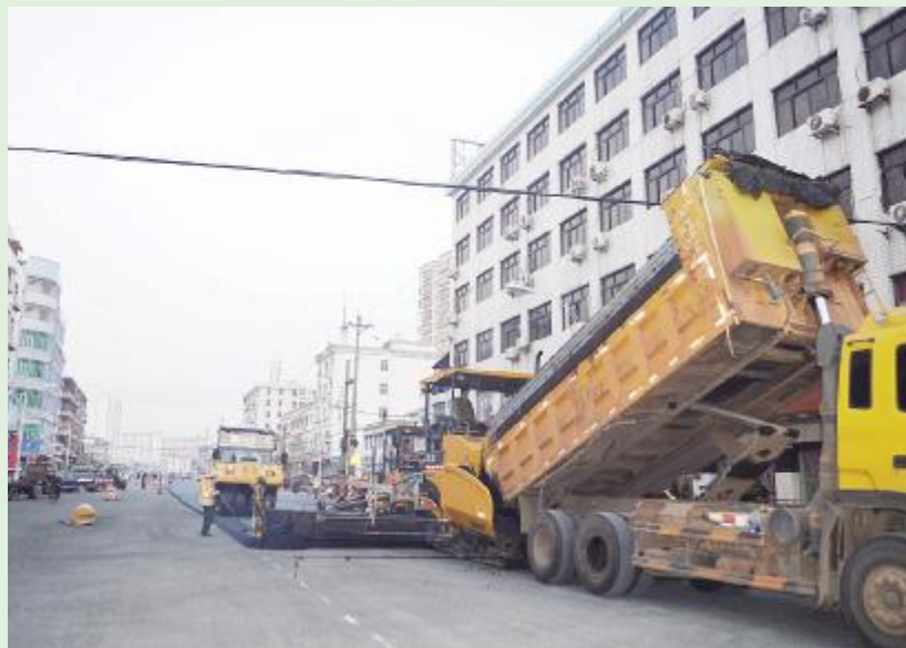
12月16日，见龙大道路面施工进入最后冲刺阶段，沥青摊铺机正紧张有序作业。