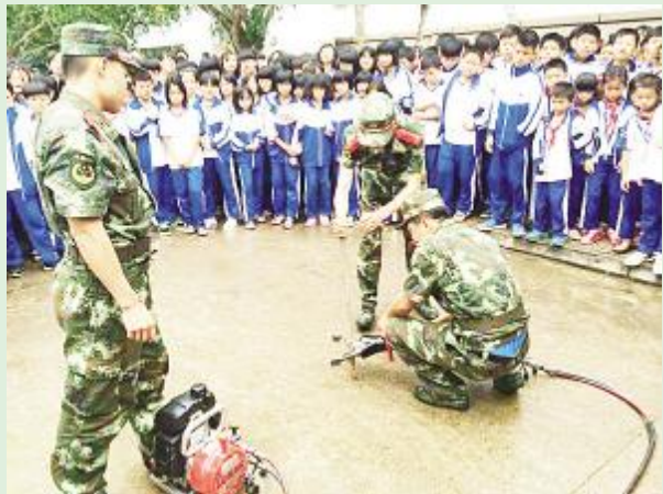
12月11日，县公安消防大队走进实验中学组织千余名师生开展疏散逃生演练活动。

2014《今日定安》杯新闻照片征集活动火热进行中，欢迎广大市民朋友及专业摄影人员，拿起手中的相机，用双手拍下新闻事件中的点滴，用镜头呈现眼里的新闻事实，记录、传播来自定安最基层的新人、新事、新精神、新风貌，使读者更直观的了解定安的发展和变化。