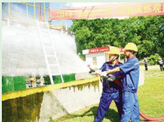
2014年“安全生产月”应急观摩会现场。