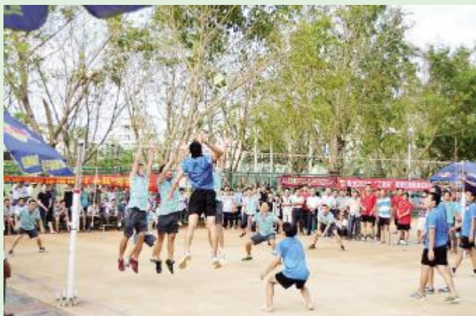
9月27日,“工会杯”排球比赛现场,激烈非凡。