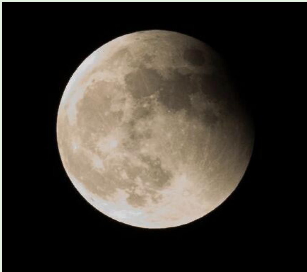
10月8日晚在定安县拍摄的月食。当晚,中国上空出现罕见的月全食天象奇观。天草 摄

2014《今日定安》杯新闻照片征集活动火热进行中,欢迎各界人士及专业摄影人员,拿起手中的相机,用双手拍下新闻事件中的点滴,用镜头呈现眼里的新闻事实,记录、传播来自定安最基层的新人、新事、新精神、新风貌,使读者更直观的了解定安的发展和变化。