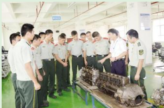
9月27日,定安消防大队结合实际工作需要,邀请省工业学校老师为大队官兵授课解惑。