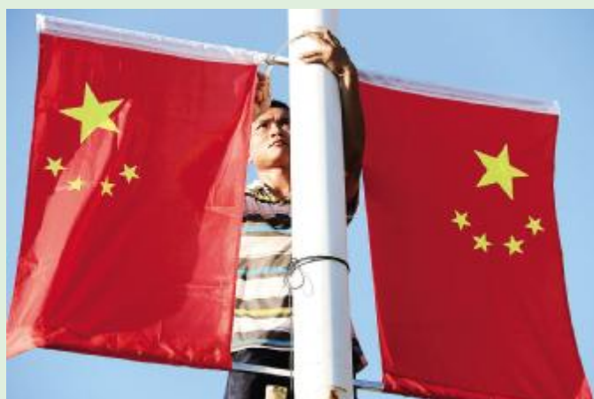
9月28日,县城各主干道都挂起了五星红旗和红灯笼,喜迎国庆的到来。