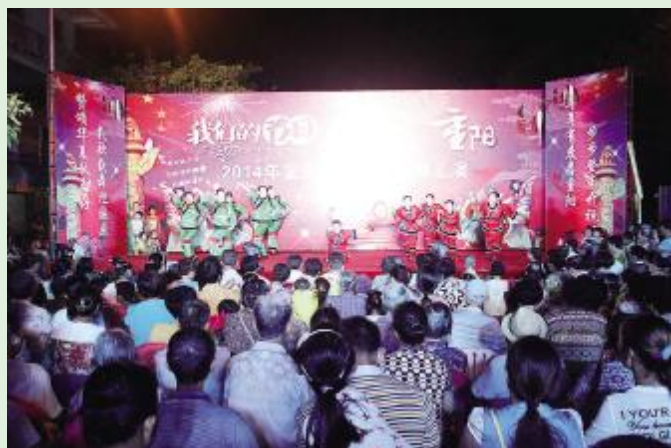
“庆国庆·迎重阳”广场舞文艺汇演晚会现场。