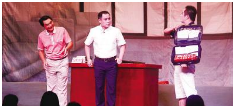
《树新风》剧照，该剧反应了党员干部在开展党的群众路线教育实践活动后在“四风”方面的转变。

“得民心者得天下，失民心者失天下！人心向背关系党的生存亡！赖书记，你今天这种举动，怎配称共产党员？你是咱镇父母官，要为百姓把事办。”7月1日晚，一场别开生面的琼剧在定安县龙河镇绿林村委会开演，来自定安县琼剧团的表现艺术家用琼剧的形式宣传党的群众路线教育实践活动开展之后，党员干部在“四风”方