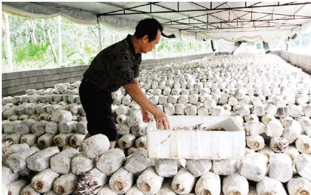
翰林镇蘑菇种植试点成功,开辟农民增收新渠道。

听说过林下养鸡鸭、林下种花卉,但是林下种蘑菇倒是一件新鲜事。翰林镇翰林村委会石山二队的一块占地面积约3亩的橡胶林地搭建起了4个大棚,往里一看,一排排菌棒整齐摆放,有黑木耳、姬菇和平菇三个品种,菌棒上一朵朵蘑菇长势旺盛,旁边的仓库中,刚采摘的蘑菇装箱待发。