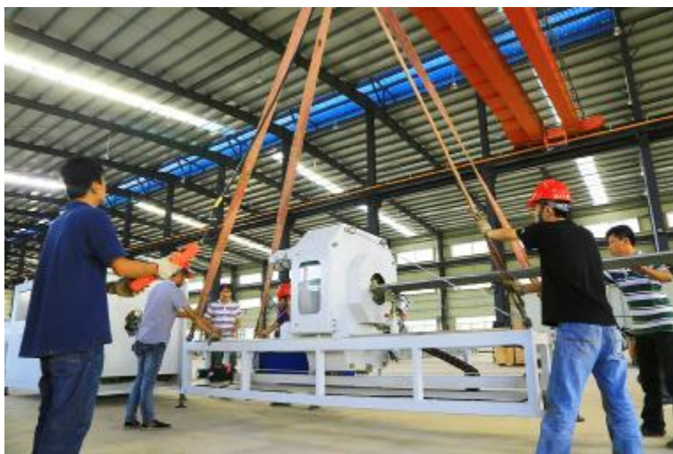
工人正在忙着安装生产机器，准备投入试生产。林先锋 摄

近日，记者从定安县塔岭管委会了解到，中国联塑塑料管道海南生产基地项目生产车间、生活区等基础工程已完工。