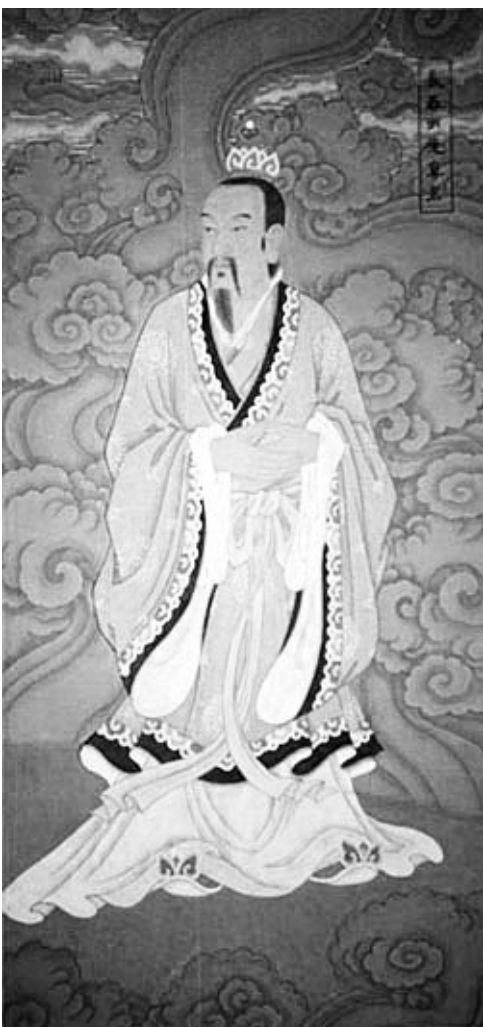
白玉蟾，南宋道人，道教南宗南五祖之一、张伯端的四传子弟，被宁宗皇帝赵扩封为“紫清明道真人”。是海南文化历史上的诗人、书法家、画家、国学大师，在中国哲学史、文学史、美术史、书法史、道教史上均有影响。