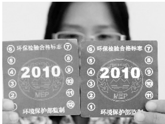
机动车环保检验合格标志。

据了解,下一步定安县将实施限行,逐步对无环保检验合格标志的机动车和黄色环保检验合格标志的机动车采取限制通行区域、通行时间的交通管制措施,并根据国家规定和海南省大气污染防治需要,适时提高绿色环保检验合格标志的标准,并扩大对超标车的限行区域。