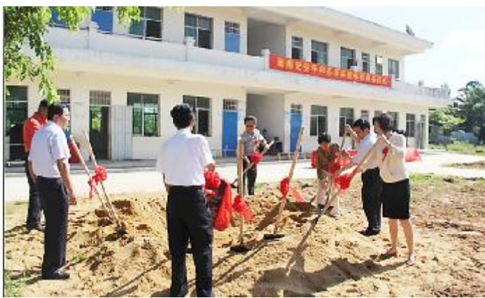
平和思源实验学校开工奠基仪式。

据介绍,平和思源实验学校项目是香港言爱基金会继仙沟思源小学之后,在定安捐资兴建的第二所思源学校,旨在解决偏远地区家庭贫困学生的读书问题。该项目在原平和小学的基础上,按照九年一贯制寄宿制学校标准建设,项目规划占地101亩,总投资5000万元人民币,其中,香港