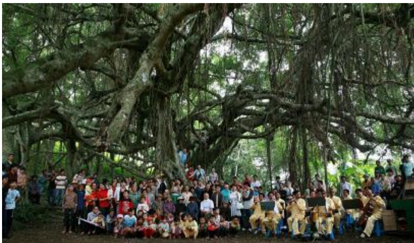
占地十亩的翰林榕树王喜迎宾客。