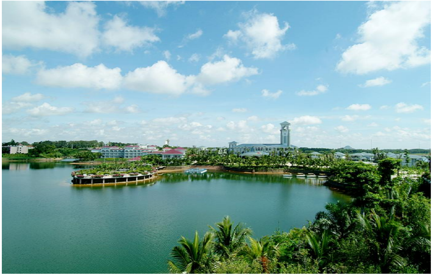
国家湿地公园南丽湖。

今后几年，定安将优先发展以生态旅游为龙头的现代服务业，围绕南丽湖、百里百村两个重点，不断加快资源整合，更加注重整体营销，完善配套设施，提升服务业档次。加强服务业配套设施建设，促进商业零售、餐饮住宿、物流快递等传统服务业的发展，优化服务业发展环境，不断提高旅游服务质量，把定安打造成琼北经济圈休闲养生旅游基地。