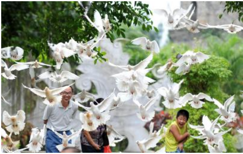
见龙塔鸟欢人悦。