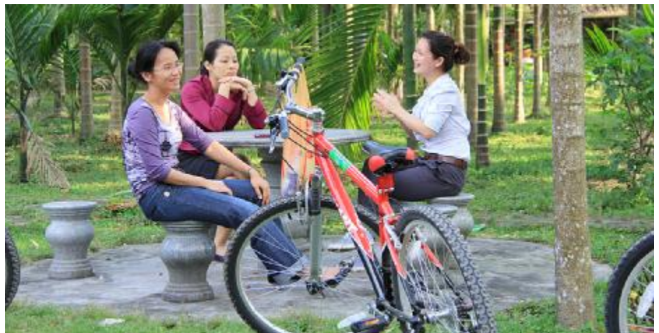
百里百村休闲游。