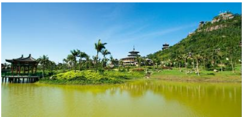
道教南宗坛文笔峰。