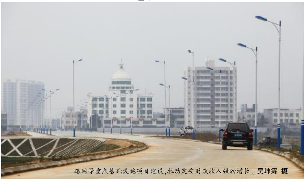
路网等重点基础设施项目建设,拉动定安财政收入强劲增长。

2011年,定安县委、县政府在强化项目推进上,不断加快基础设施建设步伐。以税源挖掘为重点,加强征管工作。以效能