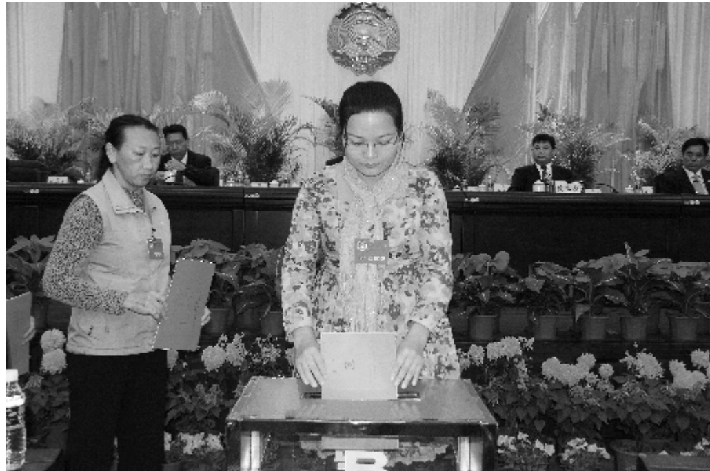
政协委员庄严投入自己神圣的一票。

17日下午15时,政协定安县第九届委员会第一次会议选举大会在县委行政办公大楼南附楼召开。会议选举政协定安县第九届委员会主席、副主席、常务委员会委员。