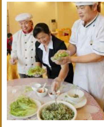
拢住家财 年味飘香 定安菜包饭