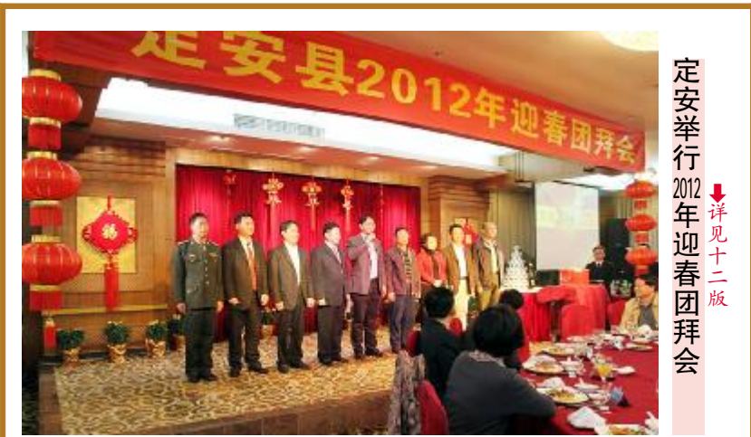
定安举行2012年迎春团拜会

新的征程已经启动,奋进的号角已经吹响,实现县政府提出的奋斗目标,需要广大干部和全县人民大力弘扬开拓创新、海纳百川,奋发图强,攻坚克难的精神,以更加宽广的视野(下转二版)