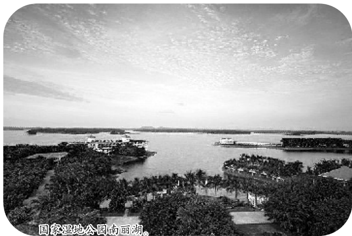
国家湿地公园南丽湖。

这个暂时还不太为人们所知晓的“长寿之乡”,就是位于我国海南省版图上的——定安县。