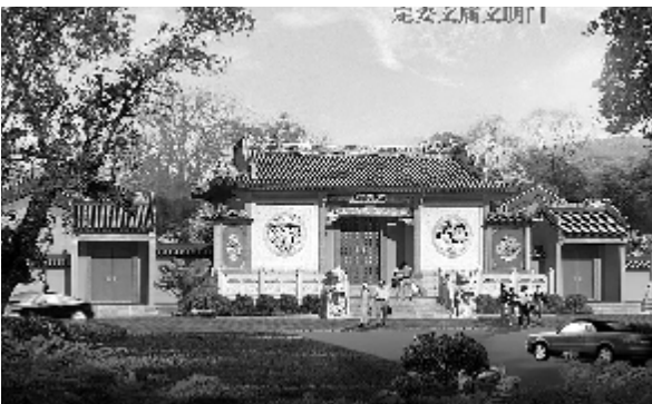
定安文庙设计效果图。

文庙的主殿大成殿始建于明洪武二年(公元1369年),永乐三年,知县吴定实重建。到了明成化八年(1472年),“副使徐裴命知县勾永升