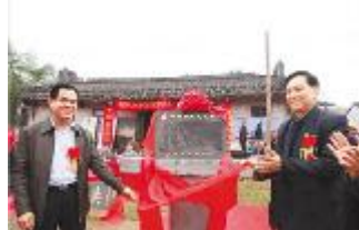
高林村被评为历史文化名村。