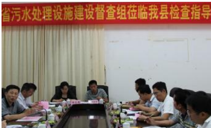
污水配套管网建设督查座谈会现场。

2010年,我县投入3500万元完成建设管网32公里及1座中途泵站建设,管网已投入使用。2011年,我县计划新建污水管网55.41公里以及4座提升泵站,采用雨污